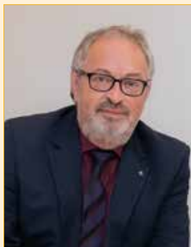
Bürgermeister Franz Engelmaier