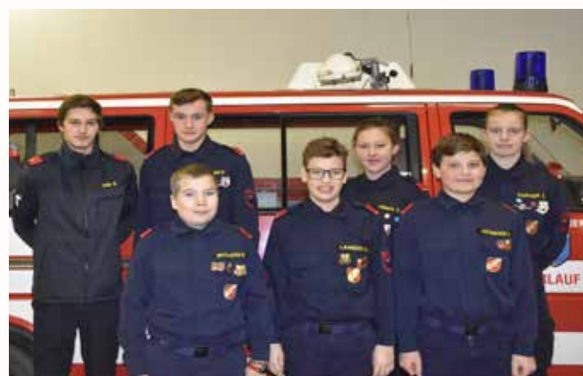
Bericht & Bilder © FF-Erlauf