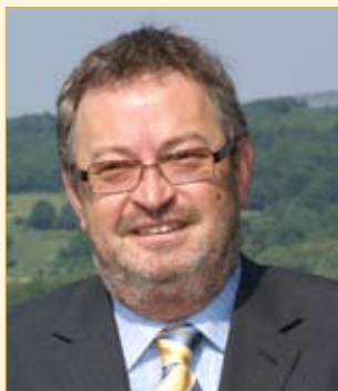
Bürgermeister Franz Engelmaier