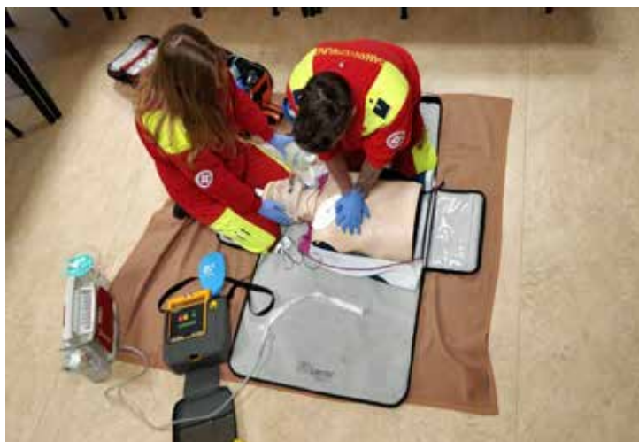
Ausschnitt einer unserer Rezertifizierungsprüfungen

Telefon: 02757/ 2466-12 Fax: 02757/ 24 66-18 E-Mail: mail@asb-poechlarn.at