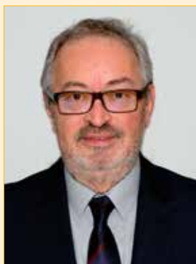
Bürgermeister Franz Engelmaier