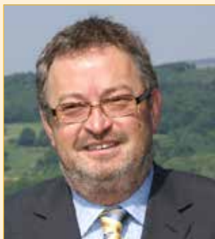
Bürgermeister Franz Engelmaier