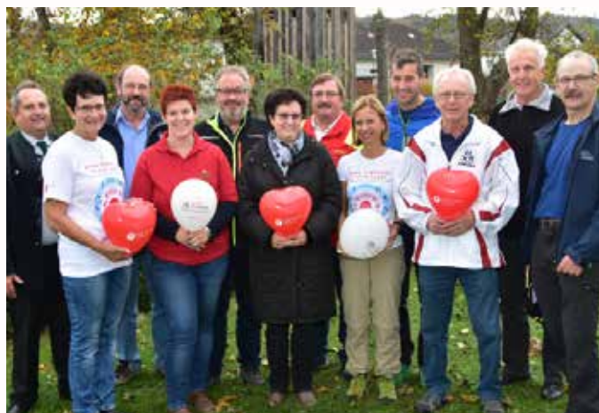
Am Foto: Das Organisationsteam des Regionswandertages!

Dank Wanderverein Krummnußbaum und den Betreuern der Labestellen, Naturfreunde Pöchlarn, Kameradschaftsbund Erlauf, ASBÖ Golling und ESV Krummnußbaum, konnten zahlreiche Wanderlustige diesen Tag genießen!