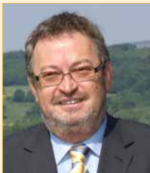
Bürgermeister Franz Engelmaier