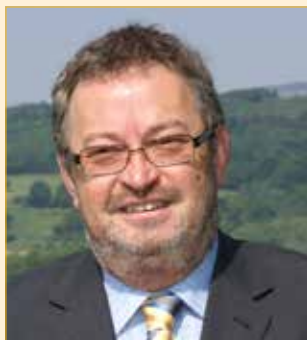
Bürgermeister Franz Engelmaier